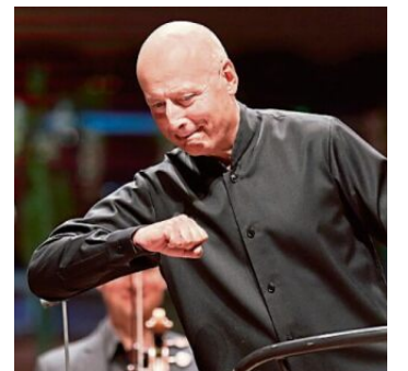
Dirigent Paavo Järvi begrüßt die Musiker.

Die beglückendsten Konzerte in Pärnu sind die, in denen Järvi Beethoven dirigiert: Die 1. Sinfonie und das 1. Klavierkonzert klingen in federnden Parlando, geistreich und mit emphatischem Schwung. Järvi steht mit seinem minimalistischen Dirigierstil souverän über den Dingen, versteht es, Beethoven gestisch zu schärfen, ohne ihn auf Krawall zubürsten, wie es derzeit Mode ist.