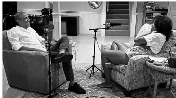
Fast zu harmonisch: Michelle und Barack Obama

darität innerhalb der kleinen Gemeinschaften anstimmen, dann lassen sie keinen Zweifel daran, dass dieser Gemeinsinn gefährdet ist. Donald Trump wird in dieser Podcast-Folge zwar mit keinem Wort erwähnt, und doch ist klar, dass gerade er nicht für das steht, was den Obamas wichtig ist: Gleichberechtigung von Frauen und Männern, die Aufhebung ethnischer Diskriminierung, vor allem aber Chancengleichheit auch in sozialer Hin-