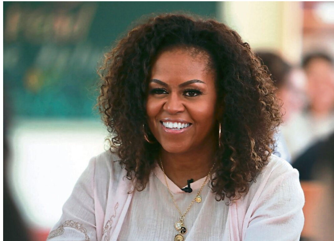
Die ehemalige First Lady Michell Obama will in ihrem -Podcast familiär bleiben.

Mit mancher Witzelei über die angesichts der Pandemie gemeinsam verbrachte Quarantäne starten die beiden in ein Gespräch, das seines vermeintlich privaten Charakters zum Trotz eminent politisch ist – gerade auch in Zeiten des Wahlkampfes. Denn wenn Michelle und Barack Obama wie ein Leitmotiv ihres Dialogs das Loblied auf die Soli-