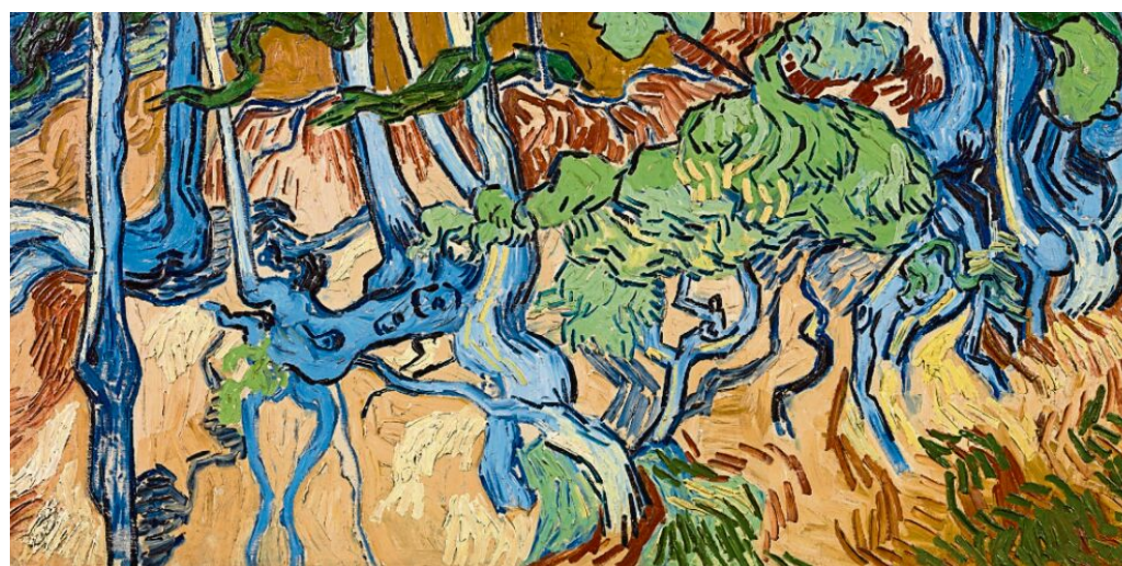
Bildbetrachtung „Baumwurzeln“ von Vincent van Gogh

In einer Sache sehen die Experten aber nun anscheinend etwas klarer: Sie wollen die exakte Stelle gefunden haben, an der van Gogh sein mutmaßlich letztes, „Baumwurzeln“ (1890) genanntes Bild malte. Auf die heiße Spur führte die Van-Gogh-Detektive eine alte Postkarte, die einen Spaziergänger in der waldigen Rue Daubigny des französischen Städtchens Avers-sur-Oise zeigt – also nicht weit entfernt von van Goghs letzter Bleibe, der Auberge Ravoux. Auf der historischen Schwarz-Weiß-Fotografie schiebt der unbekannte Mann sein Fahrrad an einer Böschung mit Baumstämmen vorbei, die eine verblüffende Ähnlichkeit mit dem etwa zehn Jahre zuvor entstandenen Gemälde zeigen.